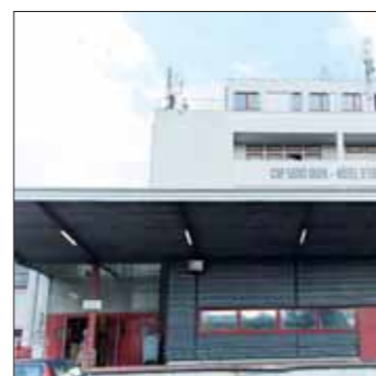
Marché aux Puces / Cap Saint-Ouen, Saint-Ouen

Le comité d'organisation du concours a décidé de retenir, pour la 1 ère session, 59 sites sur 55 communes représentant 230 hectares pour bâtir la ville innovante, durable et solidaire du XXI e siècle. Afin de ne pas saturer la capacité des investisseurs, d'ores et déjà, une deuxième session de l'appel à projets est prévue en juin 2017 pour les sites 53 restants mais aussi pour permettre aux autres communes, si elles le souhaitent, de présenter un site. Promoteurs, aménageurs, architectes et urbanistes... Ils étaient plus de 1 600, lundi 10 octobre 2016, au Pavillon Baltard de Nogent-sur-Marne pour les découvrir et rencontrer les maires qui avaient répondu présents en personne.