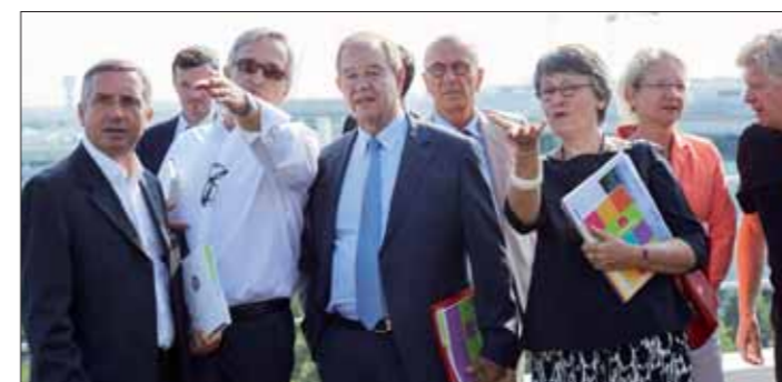
Patrick OLLIER visitant Carré Sénart avec Francis CHOUAT, Maire d'Evry et Président de Grand Paris Sud