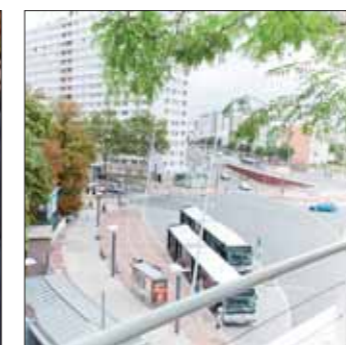
Place de la Boule, Nanterre