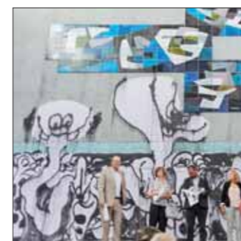
Ancienne piscine, Saint-Denis