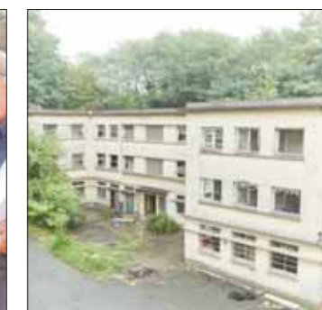
Fort des Hautes Bruyères, Villejuif